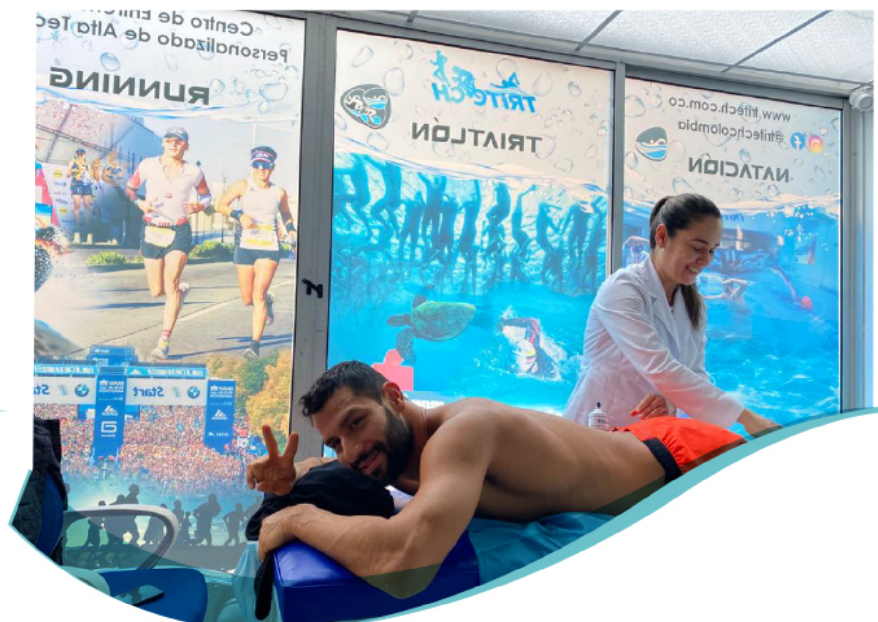
Fisioterapia y masaje deportivo