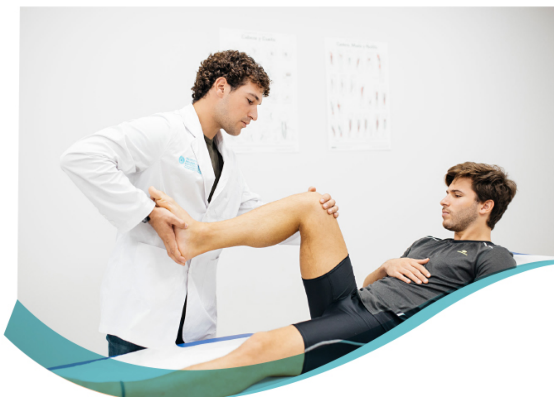
Medicina de Deporte

El descanso, el monitoreo y la recuperación son parte de la mejora en rendimiento, por lo tanto tenemos a disposición los siguientes servicios: